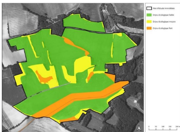
Figure 2 : Cartographie de synthèse des enjeux de biodiversité

niales, comme la Tulipe d’Agen et divers cortèges d’orchidées, grâce à des visites d’écologues et à la mise en défens immédiate en cas de présence. Les mesures de réduction complètent ce dispositif par le balisage et la mise en défens des zones sensibles, le maintien de la transparence hydraulique et écologique grâce à l’espacement des panneaux, ainsi qu’une gestion écologique reposant sur des fauches tardives, la lutte contre les espèces invasives et l’interdiction des produits phytosanitaires. Une mesure de phasage des travaux prévoit également de réaliser le broyage de la végétation et l’installation des structures hors période de reproduction et d’élevage des jeunes (mars à août), afin d’éviter tout risque de destruction de nids ou de couvées, y compris pour les débroussailllements (bande de 5 m à partir de la clôture du parc). Enfin, un suivi écologique rigoureux sera assuré par un écologue tout au long du projet, permettant d’ajuster les mesures si nécessaire et de garantir la bonne gestion des habitats préservés. Selon le dossier, l’ensemble de ces actions devrait permettre d’aboutir à un impact résiduel nul sur la flore patrimoniale et à une réduction significative des pertes d’habitats.