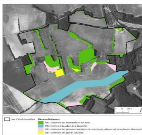
Figure 3 : Localisation des mesures d’évitement